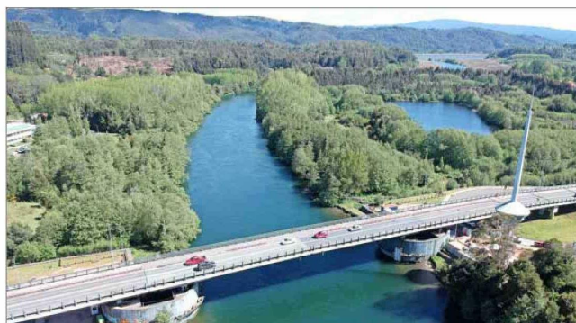
SIN LEVANTE. — Desde julio el puente basculante se mantiene sin movimiento hasta finalizar la instalación del nuevo sistema de levante.

tratos de Obras Públicas, conforme con los cuales el Ministerio de Obras Públicas se encontraba habilitado para poner término anticipado, en junio de 2015, al contrato celebrado con la empresa Azvi para la construcción del puente basculante. Ese año se paralizaron las obras por graves fallas en el sistema de levante, por lo que el Ministerio de Obras Públicas (MOP) decidió terminar el