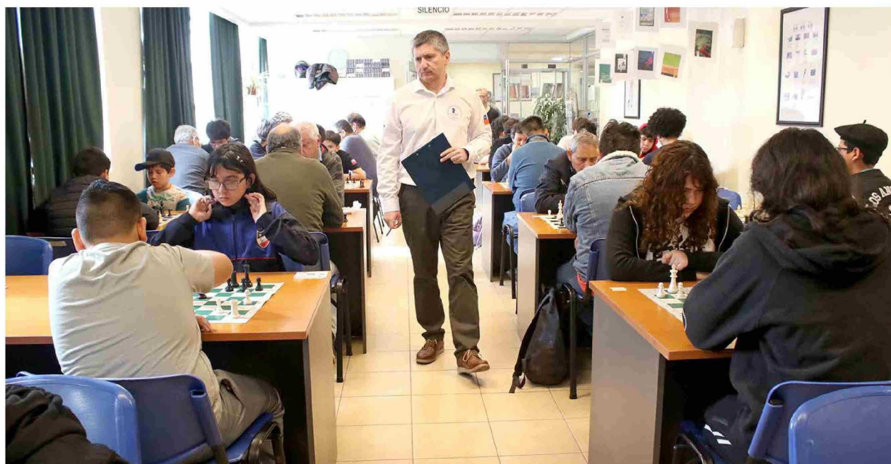
La competencia reunió a niños, jóvenes y adultos mayores, destacando por su carácter inclusivo y transversal.