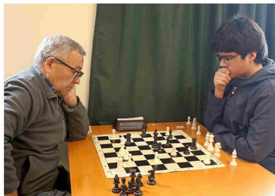
Cada mesa fue escenario de estrategias y decisiones clave en partidas que reunieron a jugadores de distintos niveles.