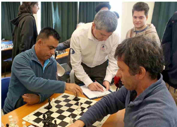
Árbitros y organizadores supervisaron las partidas para garantizar el correcto desarrollo de la competencia.