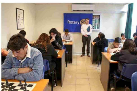
En un ambiente de concentración y respeto, participantes se enfrentaron en simultáneo durante la jornada.

La instancia permitió el encuentro intergeneracional, uno de los principales sellos del evento organizado por Rotary Machalí.