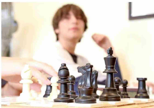
Jugadores de distintas edades participaron del torneo abierto de ajedrez organizado por Rotary Machalí en el Instituto Santo Tomás de Rancagua.

EL SEGUNDO TORNEO ABIERTO ORGANIZADO POR ROTARY MACHALÍ DESTACÓ POR SU CARÁCTER INCLUSIVO Y LA PARTICIPACIÓN DE JUGADORES DESDE LOS 8 AÑOS HASTA ADULTOS MAYORES.