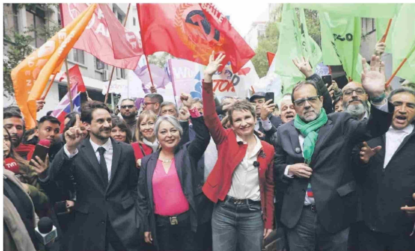
► Los cuatro candidatos del oficialismo que competirán en la primaria.

Cuando Eduardo Frei Montalva visitó Vallenar en 1968, entre la mul-