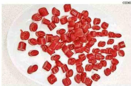
Así lucen las gomitas desarrolladas por la estudiante.

del extracto obtenido de la granada. Los análisis demostraron que las versiones con mayor cantidad de extracto tenían más antioxidantes y proteínas, y menos carbohi-