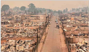
“TORMENTAS DE FUEGO”.— Este nuevo tipo de siniestros, con rápido avance a las ciudades, será cada vez más frecuente en el marco del cambio climático, dicen los expertos. En la imagen, Punta de Parra (comuna de Tomé, provincia de Concepción).