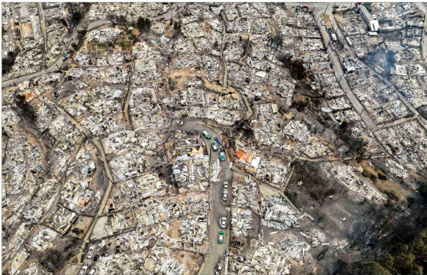
FOCO DE EMERGENCIA.— Lirquén, con 15 mil habitantes, pertenece a la comuna de Penco y es una de las localidades más afectadas por el avance del incendio. Allí las viviendas se interman en el cerro con plantaciones forestales.

En seis horas, la superficie quemada más que duplicó lo arrasado hace dos años. Entre más de 20 siniestros en combate, el que sufre la provincia de Concepción llegó a zonas urbanas de Penco y Tomé, y sumaba 25 mil hectáreas destruidas.