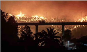
EN MÁS DE MIL SE ESTIMAN LAS VIVIENDAS DESTRUIDAS.— Un total de 19 muertos dejaban los incendios, que seguran activos en las regiones de Ñuble y Biobío, mientras otras zonas del país también sufren este tipo de siniestros. La imagen corresponde a Penco.

“Hemos aprendido muy poco en la prevención de desastres y en la capacidad de enfrentar los vectores que originan los incendios. Hay una desplanificación regional”.