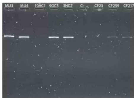
Prueba de ADN para detectar tiburón sedoso en muestras de carne de pescado de mercados locales. Las bandas visibles indican un resultado positivo. Se confirmó la presencia de tiburón sedoso en las muestras MU2, MU3, MU4, 90C5 y 3NC2.

“Muchas personas tienen la capacidad de poder decir: ‘Yo escojo comprar huevos de gallina de corral o carne sin hormonas’. Lo mismo puede suceder con el pescado capturado de forma responsable”, concluye Hearn. “Si hay suficiente empuje por parte del consumidor, preguntando de dónde viene el pescado, entonces los mercados y los restaurantes van a exigir también a sus proveedores y así sucesivamente”.