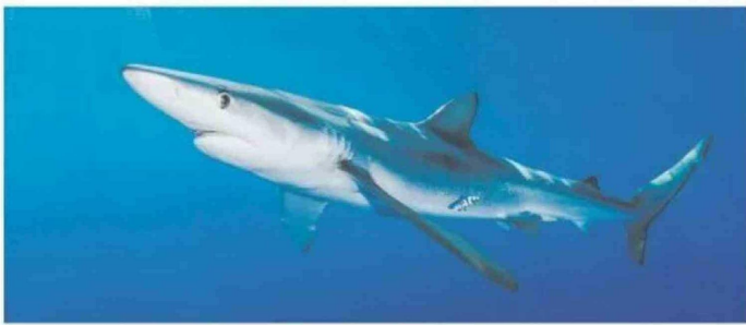
Tiburón azul ( Prionace glauca ).

sumidor en mercados tradicionales. Los procedimientos de muestreo y compra se diseñaron para capturar esta realidad.