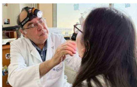
SE BUSCA FORTALECER EL ACCESO A LA ATENCIÓN ESPECIALIZADA Y OPTIMIZAR EL USO DE LA RED ASISTENCIAL EN BENEFICIO DE LOS USUARIOS.

Respecto a Urología, especialidad que no se encuentra dispo-