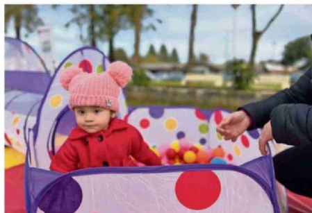
COMUNICACIONES FUNDACIÓN INTEGRA LOS RÍOS.