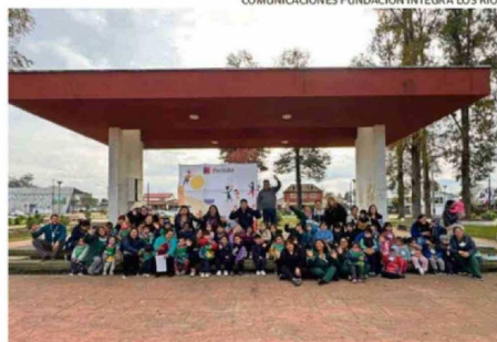
COMUNICACIONES FUNDACIÓN INTEGRA LOS RÍOS.