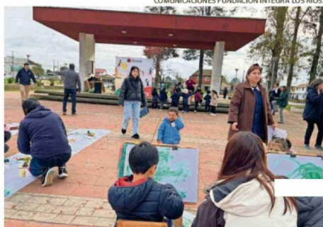
COMUNICACIONES FUNDACIÓN INTEGRA LOS RÍOS.