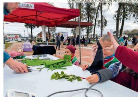
COMUNICACIONES FUNDACIÓN INTEGRA LOS RÍOS.