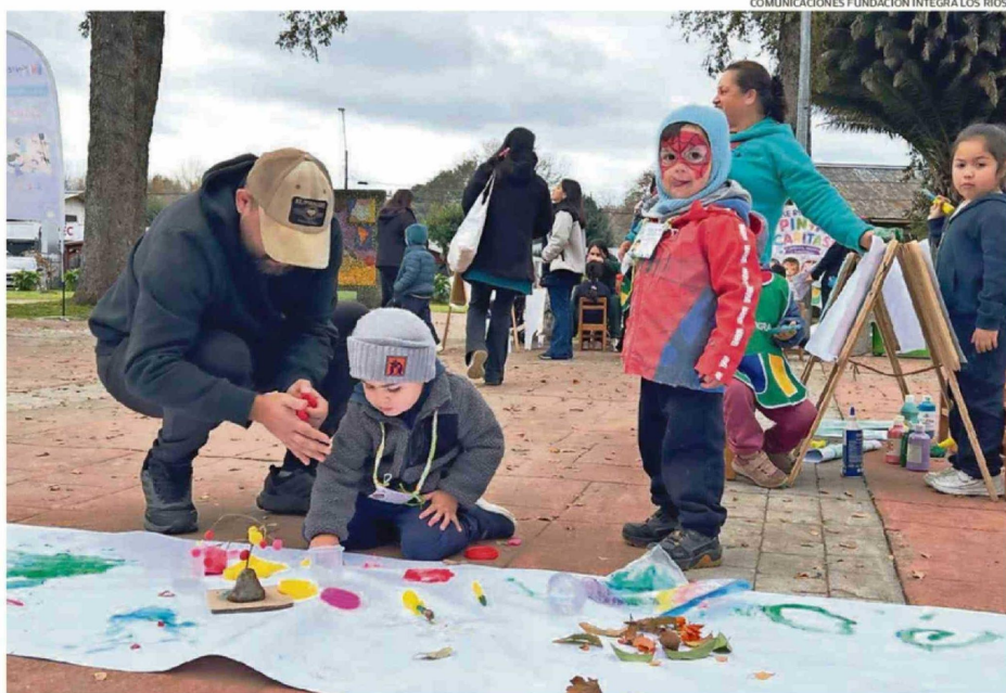
COMUNICACIONES FUNDACIÓN INTEGRA LOS RÍOS.