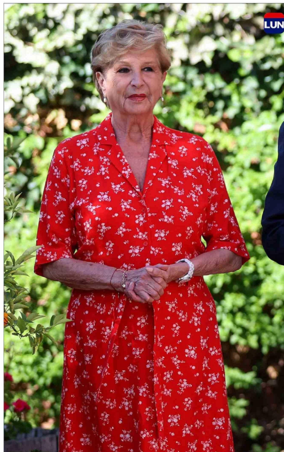
El incidente ocurrió en Santo Domingo.

Existen eventos relacionados con la picadura de abeja que pueden ir desde una reacción alérgica leve hasta un shock anafiláctico, que puede desencadenar un paro cardiorespiratorio y para que ocurra