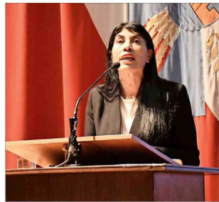
Mientras los estudiantes protestaban afuera del Aula Magna, Lincolao daba una charla sobre el rol del ministerio y el auge de la inteligencia artificial.

Los manifestantes se habrían coordinado por WhatsApp para protestar contra los recortes presupuestarios en las carteras de Educación y Ciencia y contra la administración Kast. Para ello rodearon el edificio con pancartas en las que se leía "sin ciencia no hay salud ni ambiente ni futuro", "ministerio hipócrita", "estudiante, levántate, haz revolución" y "bloqueo al fascista Kast".