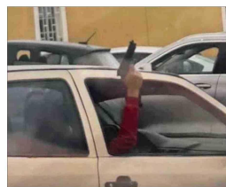
Los detenidos por este caso pasarán a control de detención hoy. En la imagen, uno de los imputados con el arma.