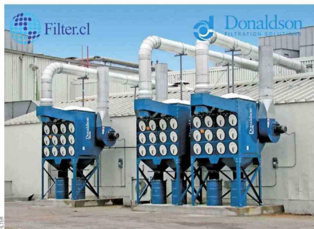
De la mano de Donaldson, Filter asegura rapidez de respuesta y soporte continuo para operaciones mineras.

con más de 15.000 productos, 2.800 patentes activas y más de 100 laboratorios técnicos destinados a validar soluciones bajo condiciones exigentes. "Ya sea a través de la consultoría estructural, el monitoreo predictivo y los contratos de gran envergadura en Filter.cl o mediante la inmediatez logística y el acceso directo al catálogo Donaldson que ofrece FilterOnline.cl , el objetivo de fondo permanece inalterable: garantizar que la gran industria minera nunca se detenga", puntualizan desde Filter.