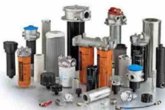
Filter desarrolla soluciones para procesos vinculados al cobre y el litio.

a resolver necesidades operacionales inmediatas de la industria minera. El sitio permite acceder a stock en tiempo real, procesos simplificados de compra y despacho prioritario directo a faena, facilitando la reposición rápida de productos Donaldson y otras marcas.