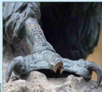
Corte en las garras del cóndor.