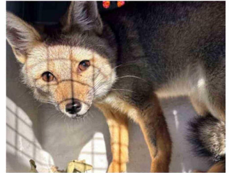
LA ZORRA CHILLA FUE LIBERADA EN SU HÁBITAT NATURAL.