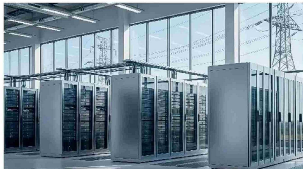
Operadores hyperscale y proyectos de IA requieren infraestructura energética con altos estándares de consumo y continuidad operacional.

Transelec tiene infraestructura en potenciales polos de desarrollo de data center y presencia estratégica en núcleos urbanos claves.