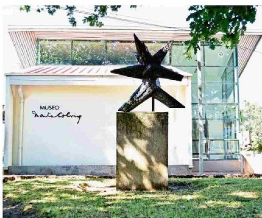
Museo que releva la vida y obra de la artista Marta Colvin.

Destacan sitios icónicos como el Parque de las Esculturas y el Centro de Innovación, y además la Universidad del Bío-Bío tiene en comodato la administración de Casa Poli, en la localidad de Coliumo, comuna de Tomé. Las dos últimas mencionadas son obras de la firma Pezo von Ellrichshausen.