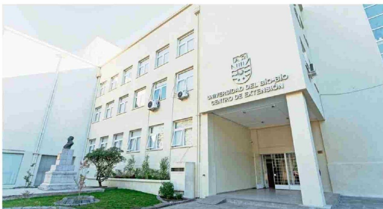
Centro de Extensión UBB en Chillán, actualmente sede de la Dirección de Extensión y otras unidades universitarias.

“El museo busca trabajar con diferentes públicos. Por una parte, está el público interno de la universidad, al cual buscamos motivar, del mismo modo que a la comunidad universitaria en general. Creemos que tiene que ver con el diálogo que podemos generar en las diversas instancias - como el Día del Patrimonio Cultural - y combinamos la entrega del conocimiento con la generación de pensamiento crítico y la valoración de la cultura, mucho más