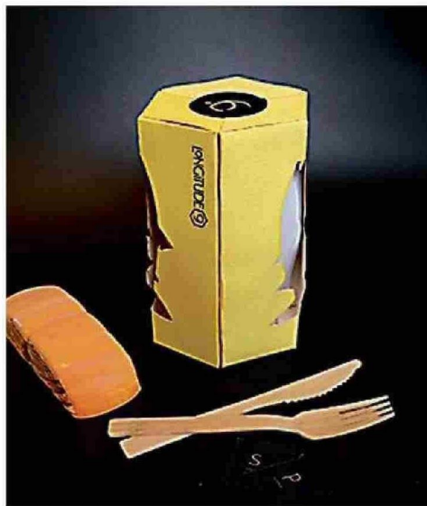
El primer lugar fue para "Longitude 9°", del equipo IAMCLIMATE, un packaging vertical de tres compartimentos que optimiza transporte, reduce residuos y es compostable.