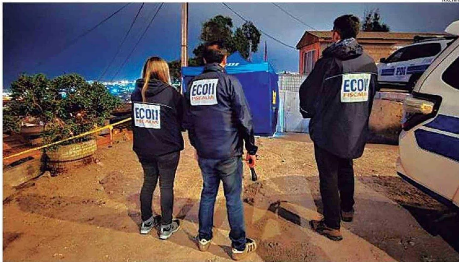
LA MAYORÍA DE LOS HOMICIDIOS OCURRIDOS EN EL AÑO 2024 SON EN LA VÍA PÚBLICA, REPRESENTANDO EL 58% DE LOS CASOS.

consumados se registraron en la región el 2024, en comparación con las 59 víctimas del 2023.