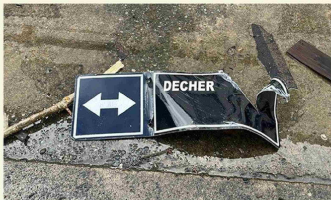
Directivos del Colegio Inmaculada Concepción de Puerto Varas encontraron una señalética de tráfico que indicaba el nombre de la calle Decher, es decir, el cartel se desplazó por casi mil metros.

madera (aparentemente la viga de alguna casa) atravesó la pared de su habitación. Sin ir más lejos, directivos del Colegio Inmaculada Concepción de Puerto Varas encontraron una señalética de tráfico que indicaba el nombre de la calle Decher, es decir, el cartel se desplazó por casi mil metros.