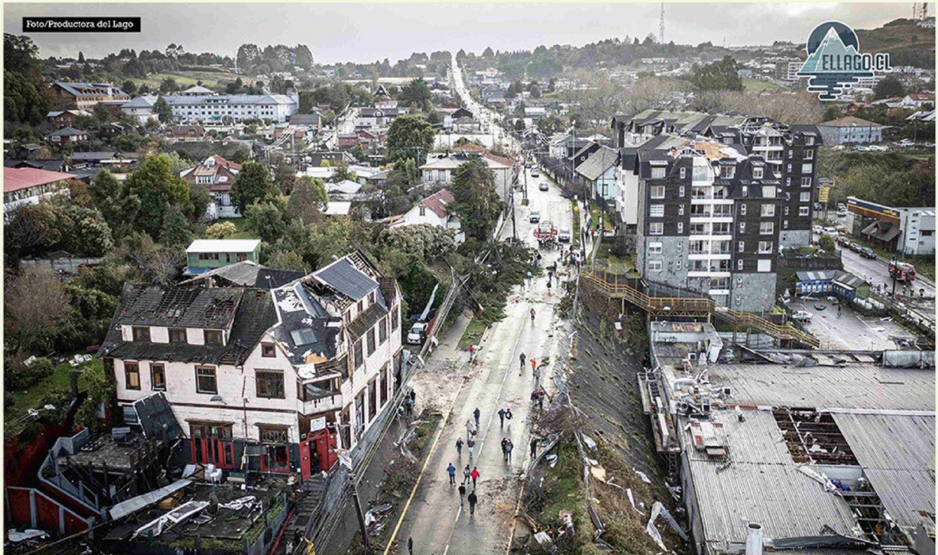
El evento tornádico tuvo una duración aproximada de cinco a seis minutos, recorriendo cerca de 5,8 km desde su punto inicial hasta su disipación, iniciando en la Ruta 5 Sur y disipándose en el sector de Puerto Chico Alto.