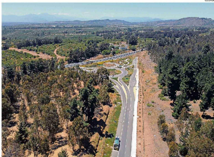
LA EJECUCIÓN TOTAL DEL PROYECTO SE PROYECTA COMO MÍNIMO, EN DOS AÑOS MÁS.

Según información entregada por el MOP, el