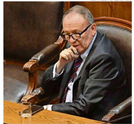
LA DECISIÓN SE ADOPTÓ TRAS REUNIÓN LA NOCHE DEL JUEVES.