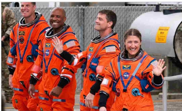
La tripulación: Reid Wiseman, Victor Glover, el canadiense Jeremy Hansen y Christina Koch.

Desde su posición no veía el reloj con la cuenta regresiva, así que desde Chile, amigos y familiares le iban avisando cuánto faltaba.