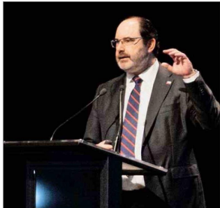
Ministro Rau en el encuentro.