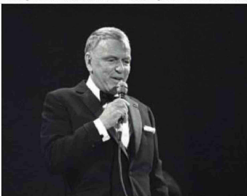
El último show de Frank Sinatra fue el 25 de febrero de 1995. En la foto, en una presentación de 1986 en Madrid.