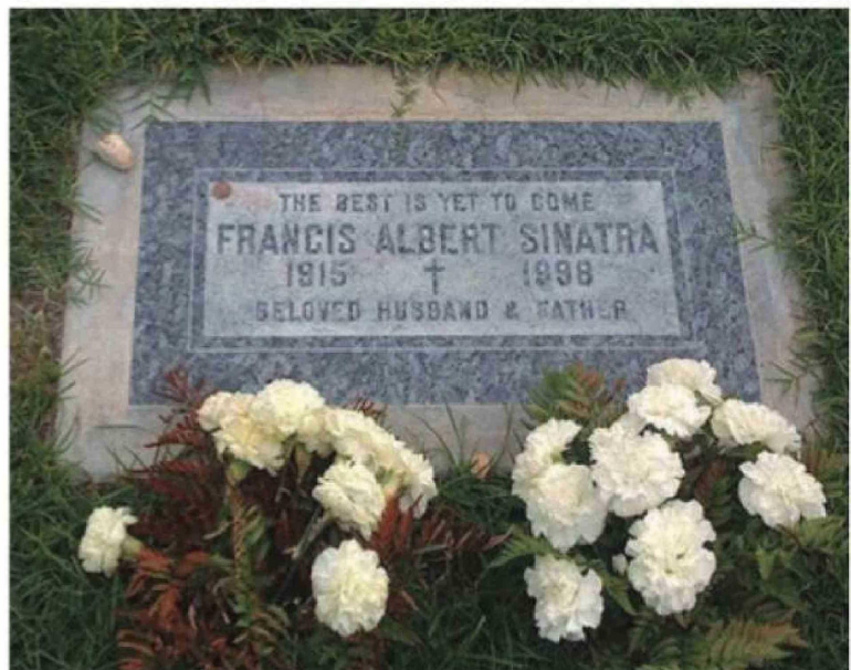
"Lo mejor está por venir", la leyenda en la lápida de Frank Sinatra que en 2020 fue vandalizada por manos anónimas.