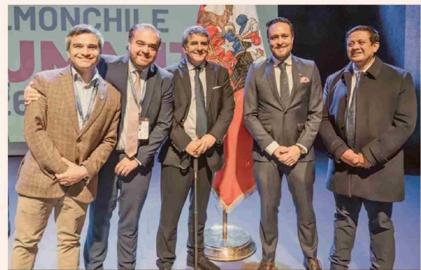
Marcelo Santana, gobernador regional de Aysén; Sergio Giacaman, gobernador regional del Biobío; Alejandro Santana, gobernador regional de Los Lagos; Rodrigo Wainrahtg, alcalde de Puerto Montt; y Marco Silva, alcalde de Calbuco.