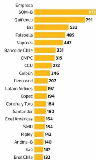
Las 20 compañías que desembolsan la mayor remuneración promedio por director En millones de pesos