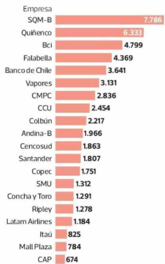
Las 20 empresas que pagan más en el total El desembolso total de cada empresa por remuneraciones de sus directores. En millones de pesos.