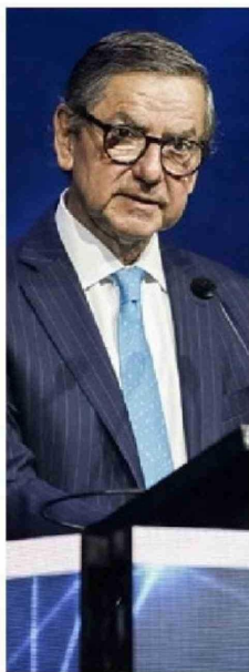
Pablo Granifo preside Banco de Chile y Quiñenco.