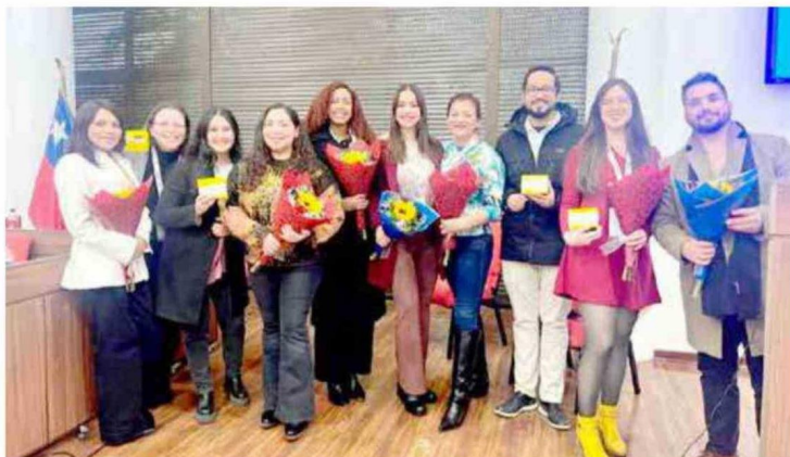
Segundas Jornadas de Diabetes y Obesidad, tuvieron cerca de 170 inscritos y muchos reconocimientos, por quienes trabajan en superar este desafío sanitario.