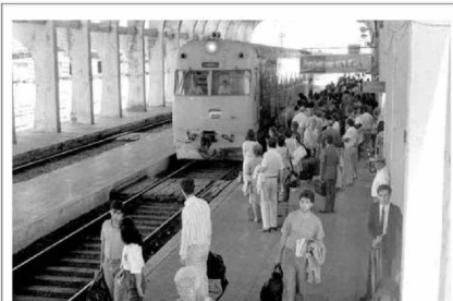
En esta imagen se observa la Estación de Trenes de Talca en finales de la década de 1970

perdieron por el terremoto del 27F y su restauración ha estado marcada por complicaciones asociadas a recursos económicos y exigencias por su calidad de Monumentos, existen otros que se mantienen y han dado un giro de modernidad, que si reflejan un avance en la calidad de vida de los habitantes de la ciudad.