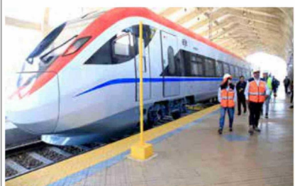
En esta fotografía, el mismo lugar, pero en el año 2025, donde se demuestra sobre todo en el tren, la modernidad.