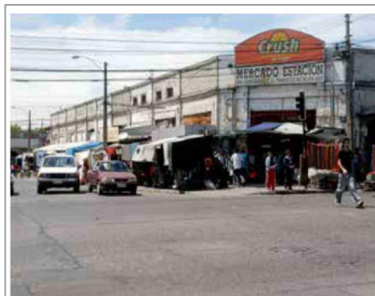
Antes del terremoto el Mercado Estación en la calle 2 Sur contaba con una amplia infraestructura.