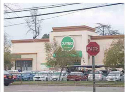
Hoy, en donde estaba la Compañía de Cervecerías Unidas se encuentra el Supermercado Jumbo