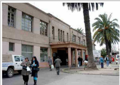
En el año 1986, así era la fachada del Hospital Regional de Talca.