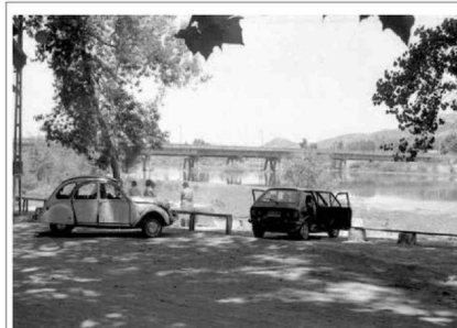
Por último, aquí vemos como era bañerío Río Claro a fines de la década de 1970 o inicios de los 80's.