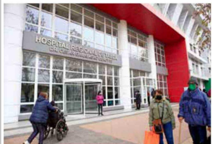
Hoy, este es el frontis de este centro hospitalario, que atiende a pacientes no sólo de la ciudad sino también de toda la región.