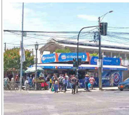
Hoy, se ve así por la misma calle, aunque los locales ubicados por la 12 Oriente ya no están, porque hoy hay un gran recinto construido para los del Persa Estación.