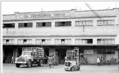
En esta foto se ve la empresa CCU, que fue clave y una gran fuente de trabajo en la época industrial de la comuna.