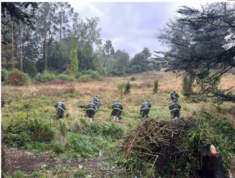
VARIOS OPERATIVOS Y RASTREOS CUMPLIÓ PERSONAL ESPECIALIZADO DEL LABOCAR DE CARABINEROS EN LA ZONA DONDE OCURRIÓ EL ATAQUE.

de servicio llevaba el suboficial en Carabineros, y en la Primera Comisaría de Puerto Varas.