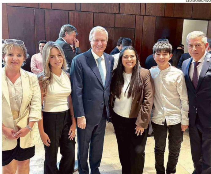
FUTURO DELEGADO, ACOMPAÑADO DE SU FAMILIA, PUDO REUNIRSE CON EL PRESIDENTE ELECTO.