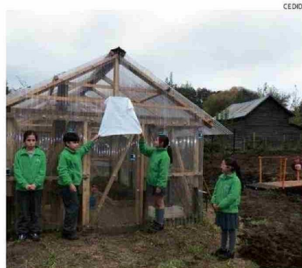
EL PROYECTO PERMITIRÁ AVANZAR EN EDUCACIÓN MEDIOAMBIENTAL.