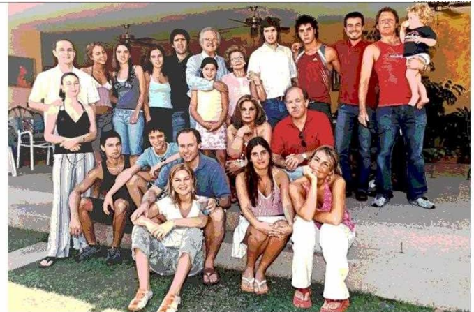
Celebrando sus 80 años, con su señora, sus cuatro hijos y parte de sus 15 nietos y 14 bisnietos.