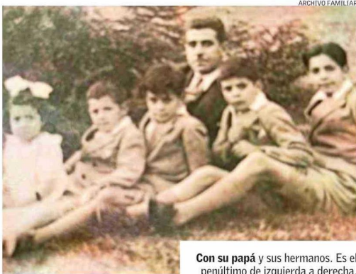
Con su papá y sus hermanos. Es el penúltimo de izquierda a derecha.

cia. "Más que un objeto cotidiano, fueron una revelación". Un descubrimiento, dice, que en su caso se transformaría en su destino.