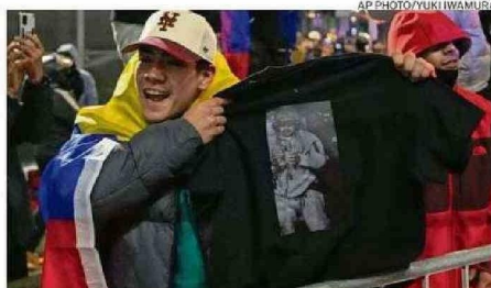
Las protestas a favor y en contra de lo ocurrido se mantuvieron ayer.

Luego el propio Trump se refirió a la decisión de mantener a Delsy Rodríguez, pero lo hizo con una amenaza. "Si no hace lo correcto, pagará un precio muy alto, probablemente mayor que Maduro", dijo a The Atlantic.