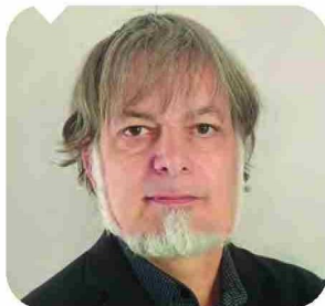
Poi Aragonés Director Alerce Chile

En industrias donde la precisión es crítica, la gestión de bodega se vuelve un factor determinante. Sectores como el farmacéutico y el alimentario operan, por ejemplo, bajo estrictas exigencias de trazabilidad y control, lo que demanda sistemas capaces de responder con exactitud y velocidad.