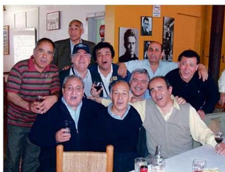
LOS INSTITUTANOS PRETENDEN SEGUIR REUNIÉNDOSE CADA AÑO.