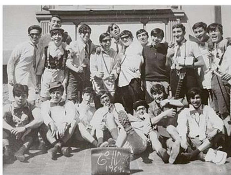
DOS INTEGRANTES DEL GRUPO HAN FALLECIDO.