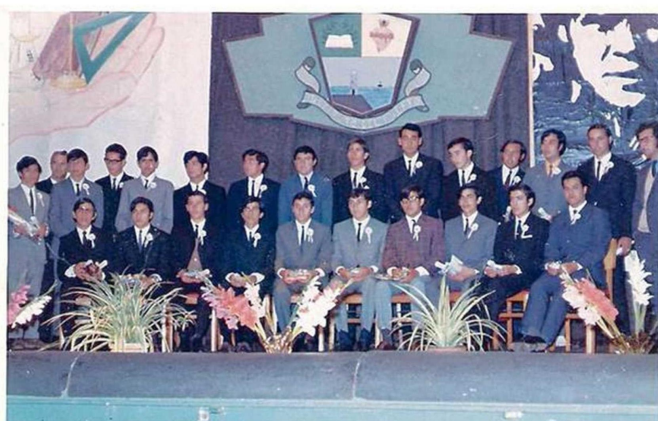
EL GRUPO DE GRADUÓ EN NOVIEMBRE DE 1969.

pudimos contactar, por lo que al menos en esta reunión seremos 20 los que nos encontraremos.