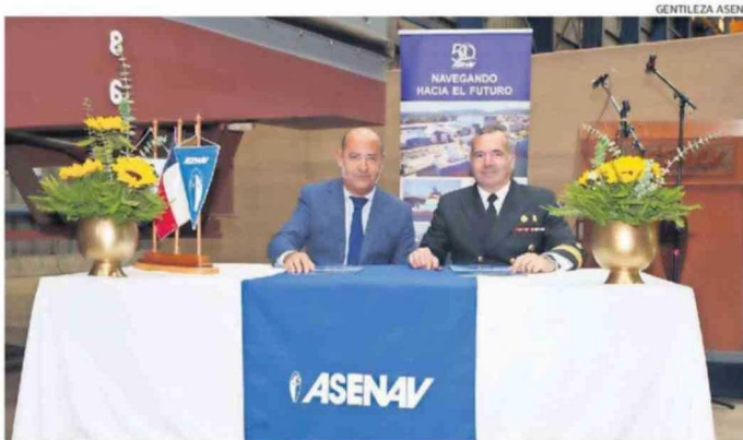
GERENTE GENERAL DE ASENAV DESTACÓ LA COLABORACIÓN PÚBLICO PRIVADA.