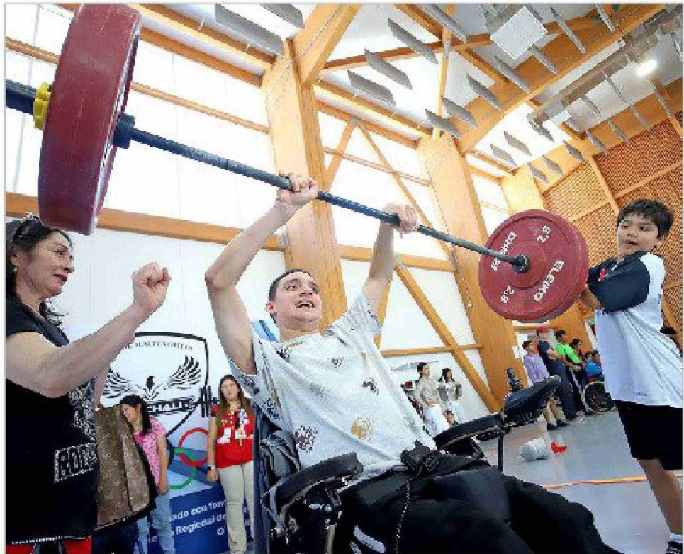
La participación del Club de Halterofilia de Machali acercó el powerlifting a los asistentes.