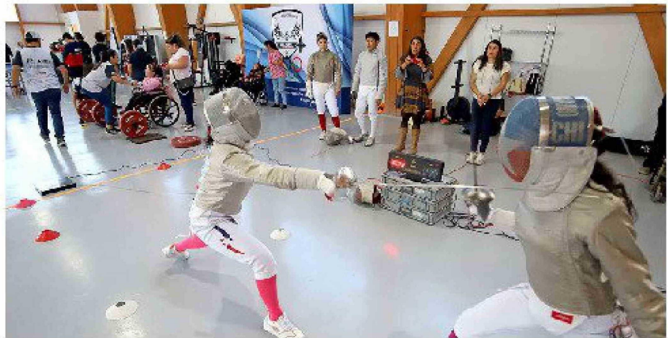
El Grandon Fencing Club estuvo presente con una estación dedicada a la esgrima.