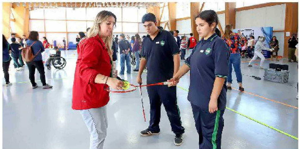
El bádminton fue una estación llamativa para los asistentes.