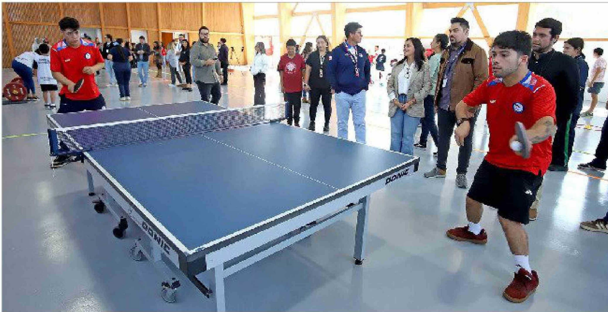
Destacados tenistas paralímpicos acudieron hasta el Instituto Teletón O'Higgins en el Día Nacional del Deporte.