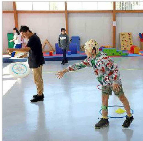
El programa "Experiencia Estadio" de Codeco llevó el frisbee hasta el gimnasio del Instituto Teletón.

Así, la jornada no solo conmemoró el Día Nacional del Deporte, sino que también reforzó la importancia que radica en avanzar hacia una práctica deportiva más inclusiva, donde todas las personas tengan la oportunidad de participar, desarrollarse y sentirse parte de distintos espacios.