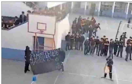
CONSIGNA.— También se desplegó un lienzo alusivo al "Día del joven combatiente" en el que se leía "ni perdón ni olvido hacia el Estado asesino".