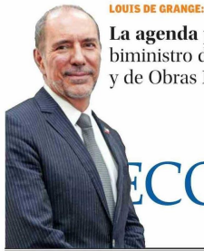
LOUIS DE GRANGE: La agenda portuaria del nuevo biministro de Transportes y de Obras Públicas B 5