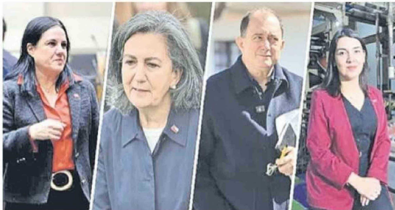
Los ministros de Seguridad, Trinidad Steinert; de Salud, May Chomali; de Vivienda, Iván Poduje; y de la Mujer, Judith Marín.

En tanto, la ministra de Salud, May Chomali, anunció en la comisión de Salud del Senado que el recorte para su cartera bajaría finalmente al 2,5%, luego de una "negociación difícil" con la Dipres y con Quiroz.