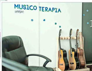
La sala de musicoterapia es una de las que se incorporó gracias a esta ampliación.