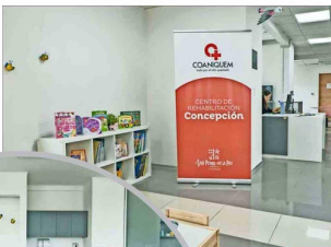
La ampliación permitió aumentar las especialidades y las horas de atención, incluyendo psicopedagogía, musicoterapia, entre otras.