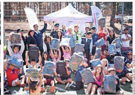
Tomé. La ministra (s) de Educación, el subsecretario del Interior y la directora de Junaeb entregaron mochilas y útiles a estudiantes damnificados de Punta de Parra.

Penco. El futuro ministro Poduje recogió demandas de autoridades locales y vecinos.