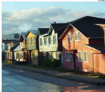
EN CASTRO TAMBIÉN ES MUY DIFÍCIL ARRENDAR UNA VIVIENDA.