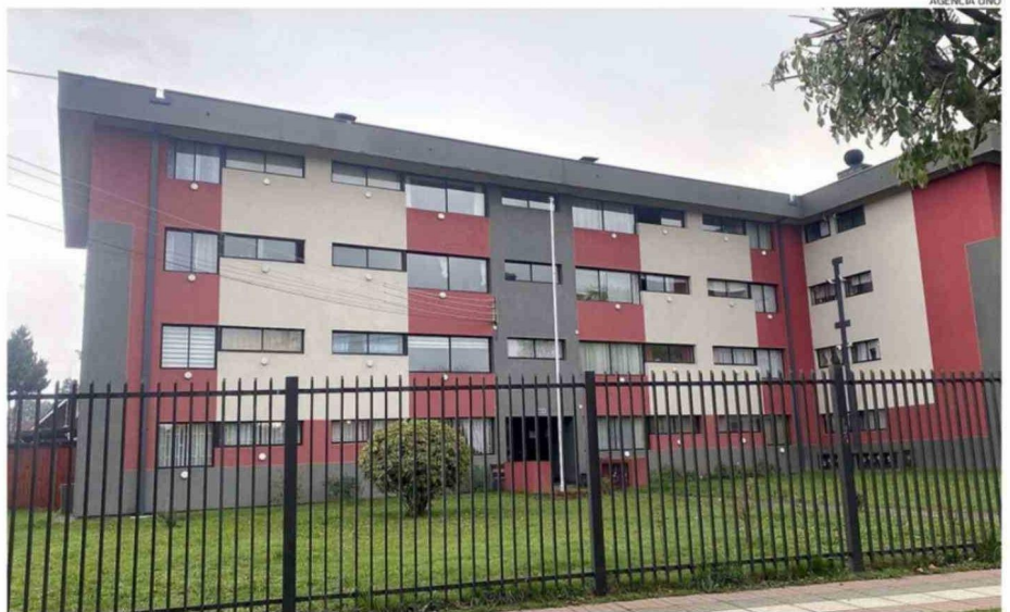
LA OFERTA PARA ARRIENDO DE DEPARTAMENTOS ES AMPLIA, COMO EL CASO DE LOS CONDOMINIOS ANTILLANCA EN OSORNO (EN LA IMAGEN).

En Chile, para ejercer como corredor de propiedades no se exige un título universitario ni estudios formales obligatorios; se trata derechamente de un oficio. No obstante, existen