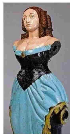
MASCARÓN DE PROA DE PABLO NERUDA.

salones" (1920-1930), su mayor exponente, Osmán Pérez Freire, compositor y pianista, llevó al pentagrama creaciones como "Mar de fondo" y "El marinerito", hizo bailar a las casas más acaudaladas de San Antonio y Cartagena.