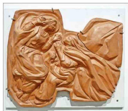
Una de las obras que mostró el año pasado en el Centro de Extensión UC.

A sus 95 años falleció el recordado artista visual, muralista, dramaturgo, director teatral y animador de la cultura.