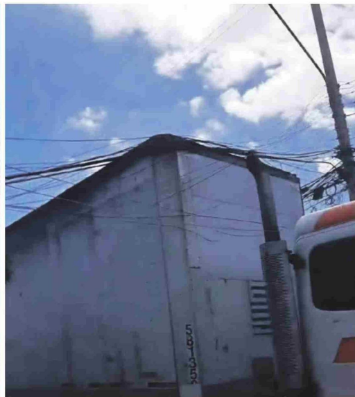
Dos viviendas resultaron con daños luego de que un camión de alto tonelaje derribó tres postes en la población Cancha Rayada.