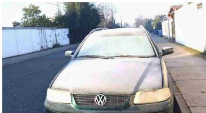
Muchos conductores encontraron a sus autos con los vidrios congelados.