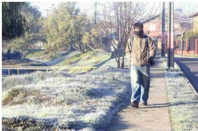
Jóvenes salieron muy abrigados ayer en Talca, porque a las 9 de la mañana la temperatura era de -5° Celsius.

la Dirección Meteorológica de Chile. Para hoy, se pronosticaron por Meteochile, -3° en Parral, -2 grados en Talca y Linares, -1° en Curicó, Molina y Cauquenes, registrándose máximas de 13 y 14 grados en todas las comunas mencionadas, anteriormente.