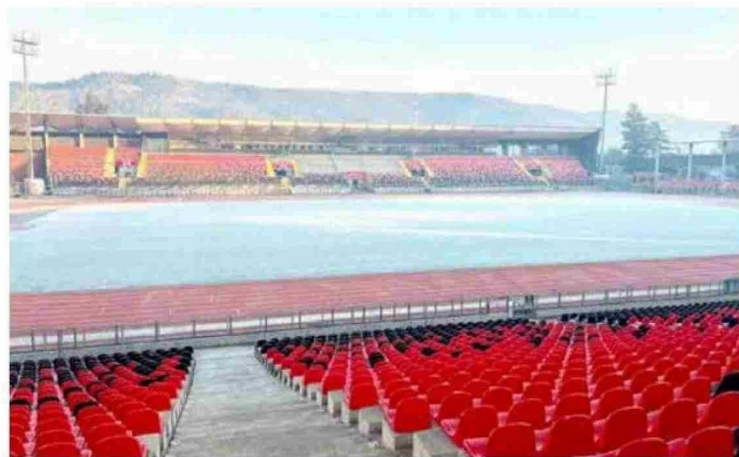
El Estadio Fiscal de Talca parecía ayer una verdadera cancha de patinaje en hielo, con su nuevo césped congelado. Se espera que no haya sufrido daños con estas inclemencias climáticas.

Desde el miércoles al viernes de esta semana, comenzará a subir progresivamente la temperatura, llegando solo a 5 grados en Constitución y 3 grados en el resto de las comunas, alcanzado máximas de solo 16 grados. AccuWeather, en tanto, registró a las 10 de la mañana, -3 grados en Longaví, -2 en Talca, -1 en Parral, Retiro y en Cauquenes, mientras que en Curicó subió a 1 grado y Linares a 3.