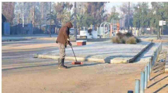
Plazas y parques en el Maule, mantuvieron por varias horas su césped congelado.