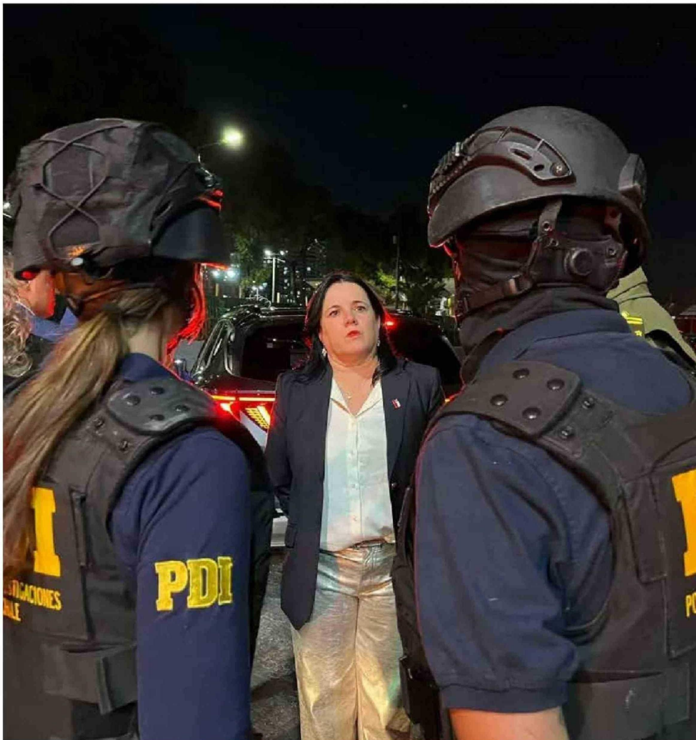
►Tras su complejo debut, la agenda de la ministra Trinidad Steinert ha estado marcada por un amplio despliegue.

La secretaria de Estado intenta dejar atrás el fantasma de la crisis con la PDI. Su equipo partió la semana anunciando un acuerdo millonario con EE.UU. para combatir el crimen organizado y además pretende impulsarla como una sheriff operativa y en terreno. Sin embargo, el diseño para que la exfiscal dé vuelta la página encontró la semana pasada un nuevo enemigo: el propio oficialismo.