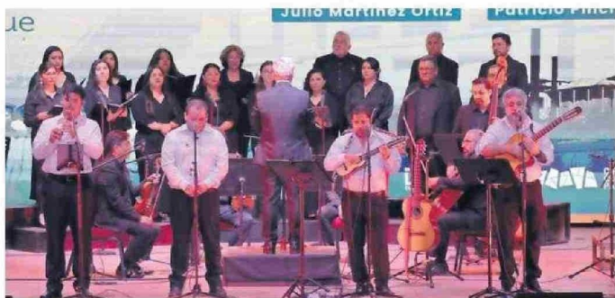
55 AÑOS DE LA CANTATA SANTA MARÍA DE IQUIQUE.

Actividades contempló el Circuito Cultural de la Unap en el 2025.