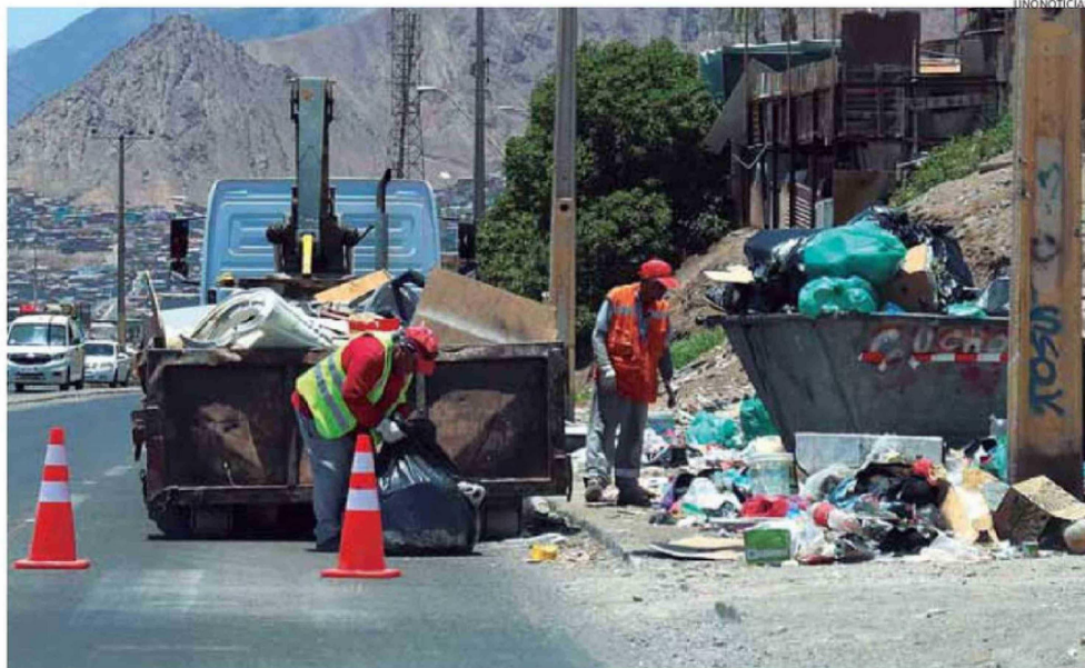
A PESAR DE CONTAR CON RECOLECCIÓN DIARIA DE BASURA, SE SIGUE ACUMULANDO DESECHOS.

"A nivel de Padre Hurtado y en gran parte de su extensión, pasa eso, si uno va caminando