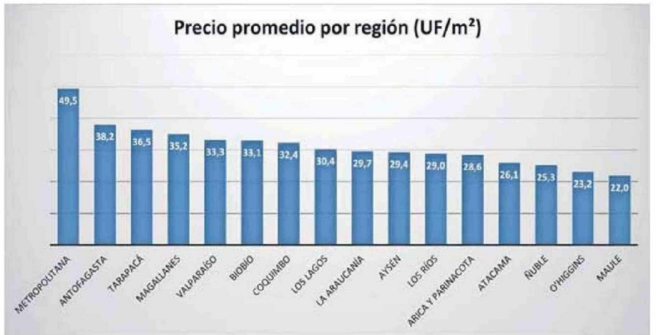
FUENTE: "INDICADORES REGIONALES DE VIVIENDA" DEL MINVU, A MARZO DEL 2026.

Lo anterior, profundiza, "se ha traducido en una significativa disminución de permi-